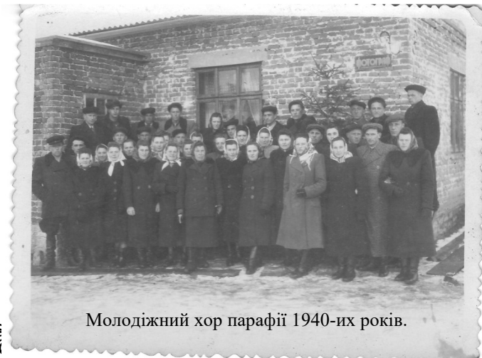
Молодіжний хор парафії 1940-их років.

Минув час, милостивий Господь забрав до себе багатьох із тих, кого ми бачимо на світліні. Та запитаймо себе, чи ми живемо так як вони, тим духом віри і праці на Славу Божу і добро України? І чому нашої молоді так мало у хорі?