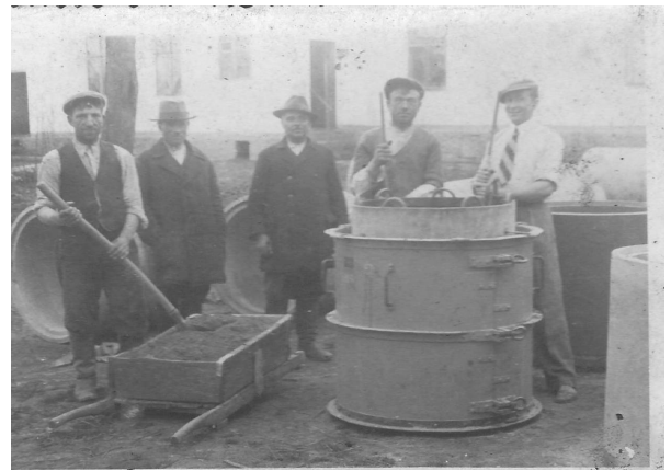
Праця на підприємстві будматеріалів.