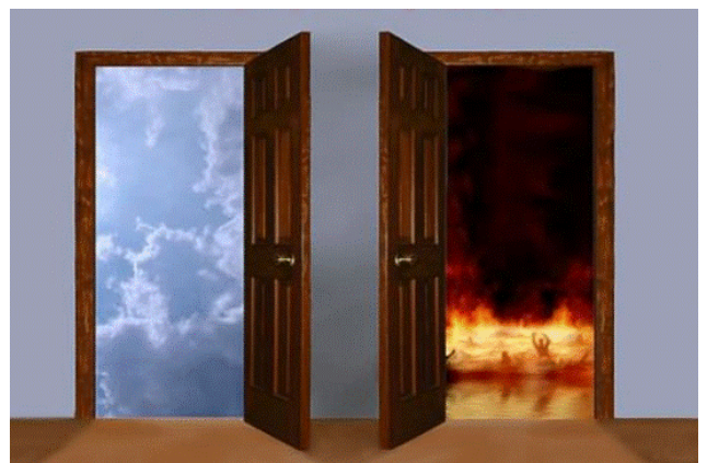
Вибери правильні двері!

-Тоді дай мені гроші на морозиво, бо я розбив твої окуляри!