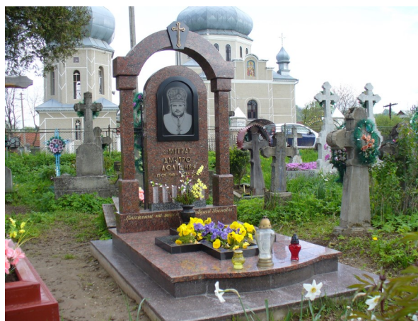
На могилі у селі Стопчатів