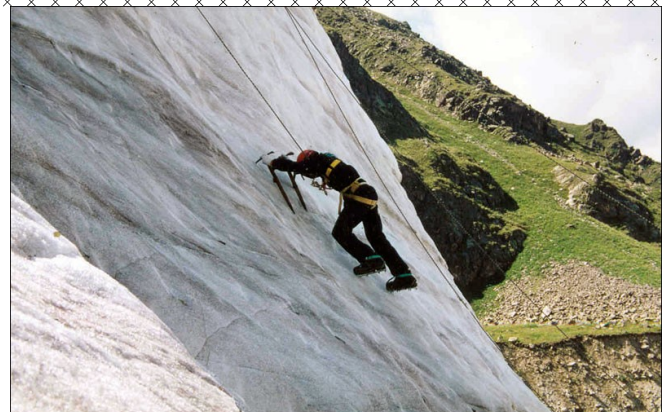
До Бога - ще важча дорога!