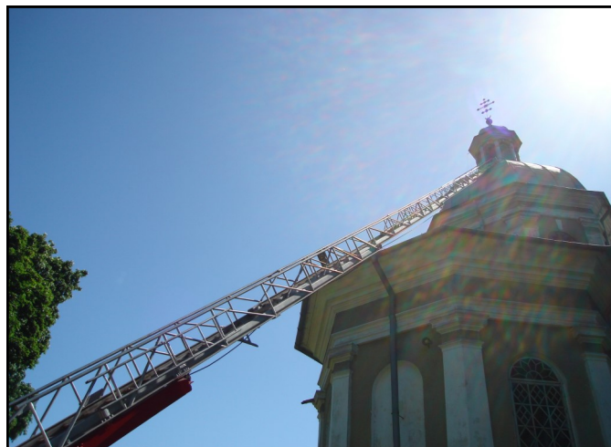
Нелегка дорога до духовних висот...

- Ага, бачите, якби ви тоже не вмiли ходити, ти, не мали зубів, не вмiли говорити і вам постійно під ніс сунули всякі брязкальця, то ви б ще не так кричали.