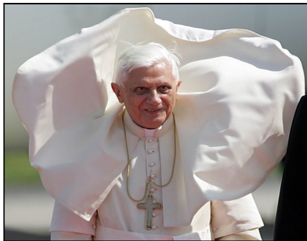
Навіть Папа інколи кумедно виглядає!

- То дивне. Я вже тридцять років місіонером, не раз мене викидали за двері, копали, били, але досі ще ніхто не ображав.