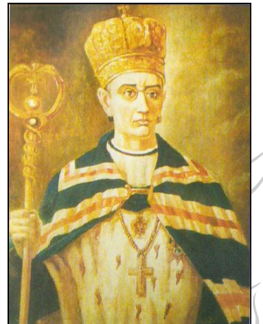
Митрополит С. Сембратович