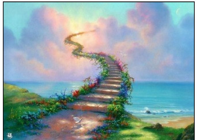
Не бійся йти дорогою правди!

Газета парафії Успіння Пресвятої Богородиці смт. Козова Тернопільсько-Зборівської єпархії УГКЦ. Виходить щомісячно. Редактор: о. Михайло Забанджала Друк: "Комп'ютер сервіс"