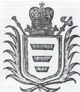
Герб Й. Шумлянського

І саме цей владика, майбутній кардинал, 23 вересня 1894 року приїжджає у Козову для того, щоб особисто освятити новий престіл у новозбудованому храмі на честь Успіння Богородиці, парафіяни якого з 1885 року очікували на візит сюди свого духовного батька.