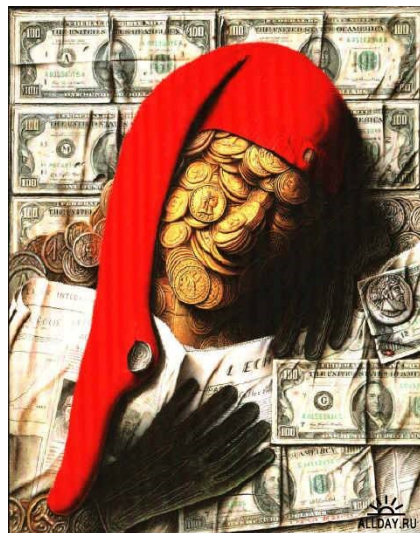
Такі портрети малює жадібність.